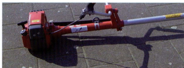
Detailopname: stuurstang met ophanging.